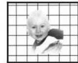
5. Head very high over the horizontal line, almost vertical position.